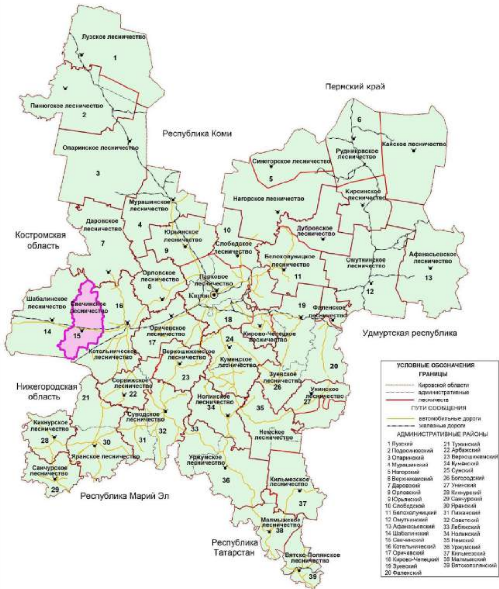
Рисунок 1. Карта-схема Кировской области с выделением территории Свечинского лесничества