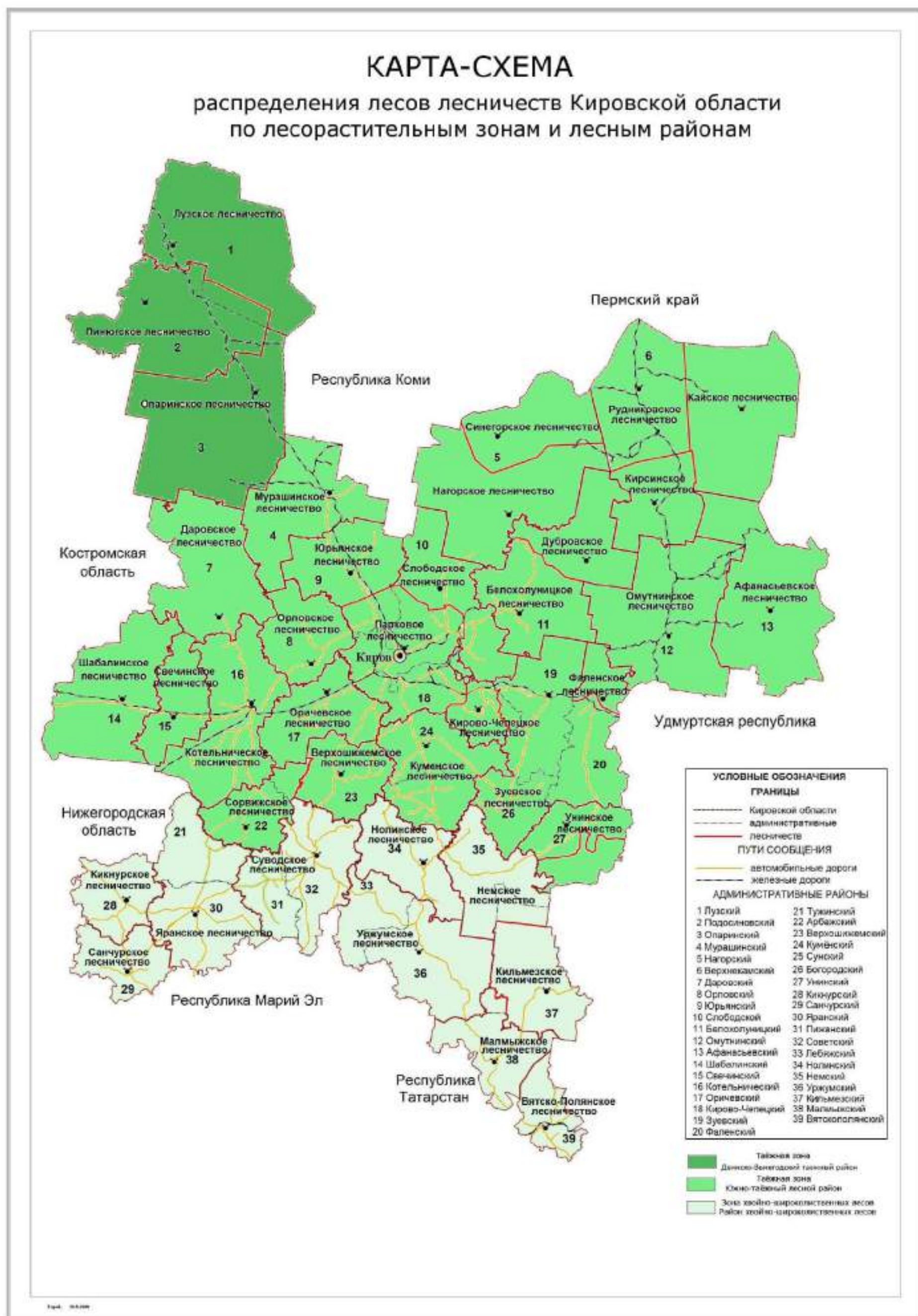
Рисунок 3. Распределение лесов лесничеств Кировской области по зонам и районам