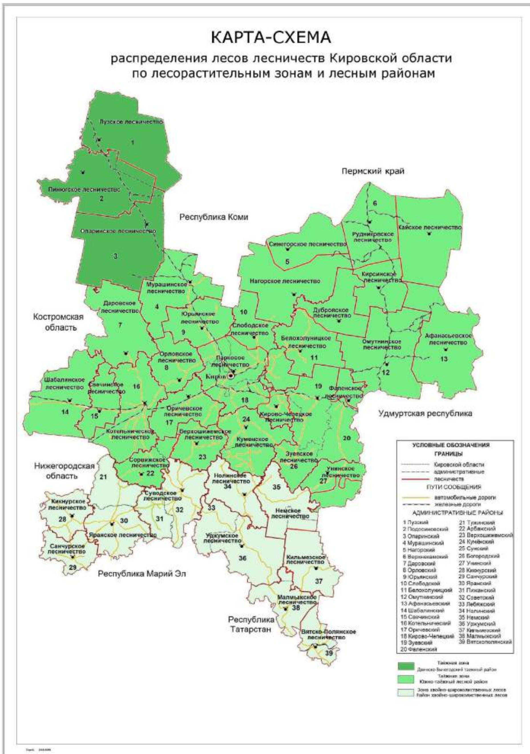
Рисунок 3. Распределение территории лесничеств Кировской области по лесорастительным зонам и лесным районам