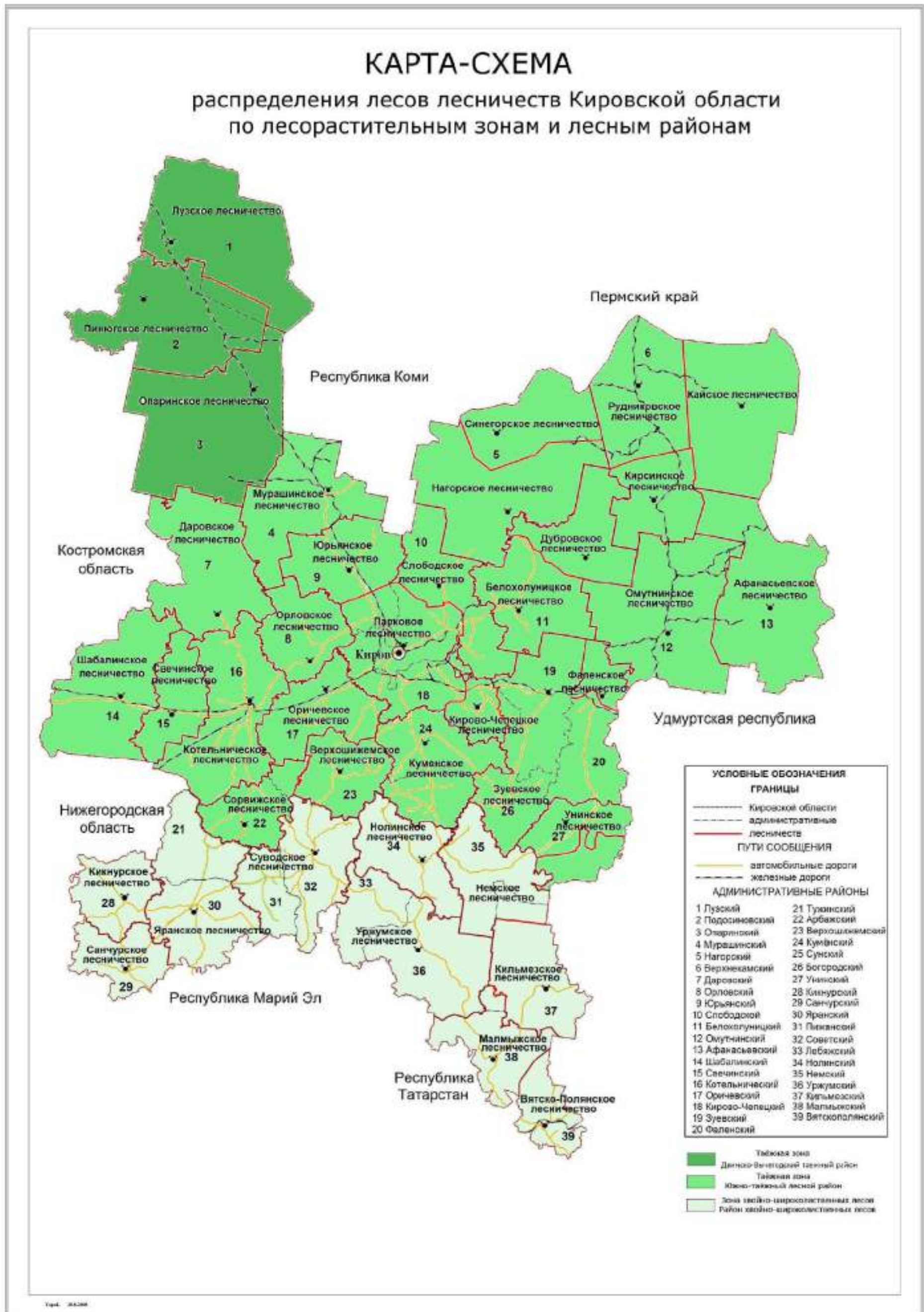
Рисунок 3. Распределение лесов лесничеств Кировской области по зонам и районам