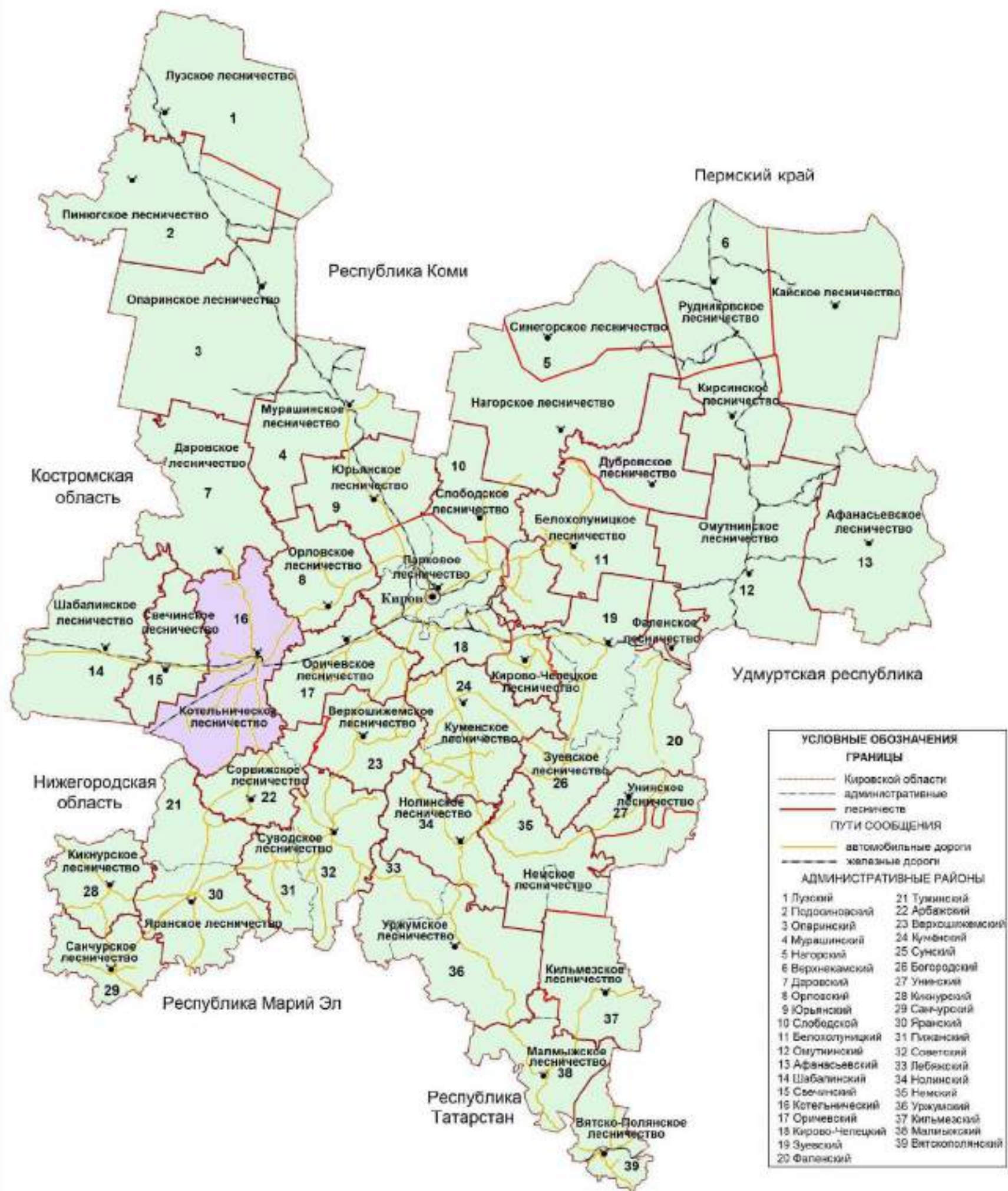
Рисунок 1. Карта-схема Кировской области с выделением территории Котельничского лесничества