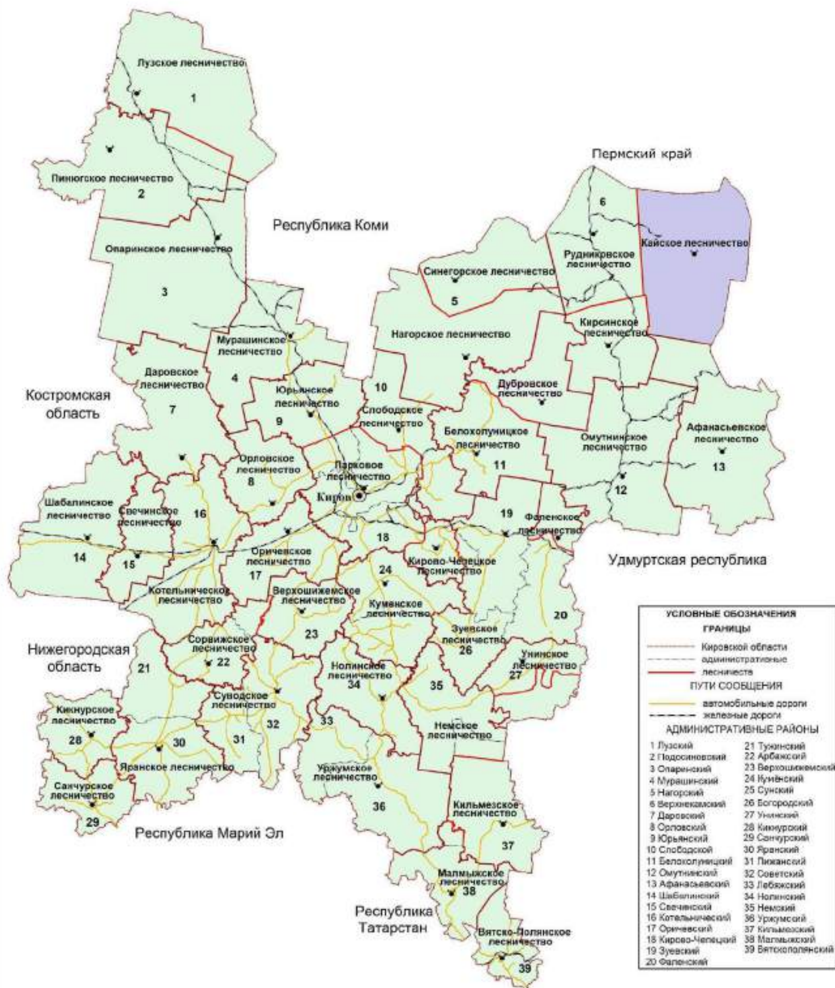
Рисунок 1. Карта-схема Кировской области с выделением территории Кайского лесничества