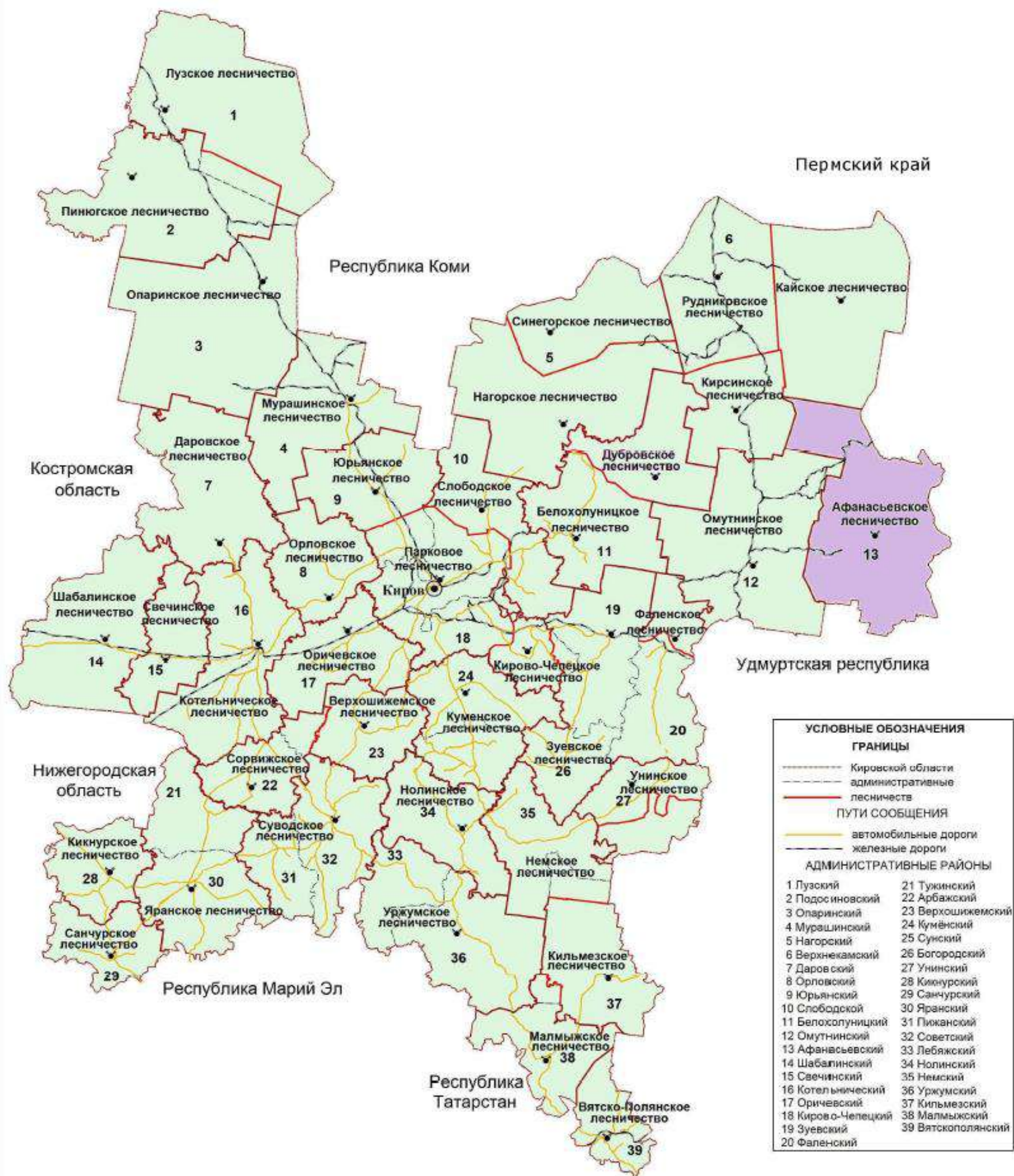
Рисунок 1. Карта-схема Кировской области с выделением территории Афанасьевского лесничества

территориального расположения Афанасьевского лесничества