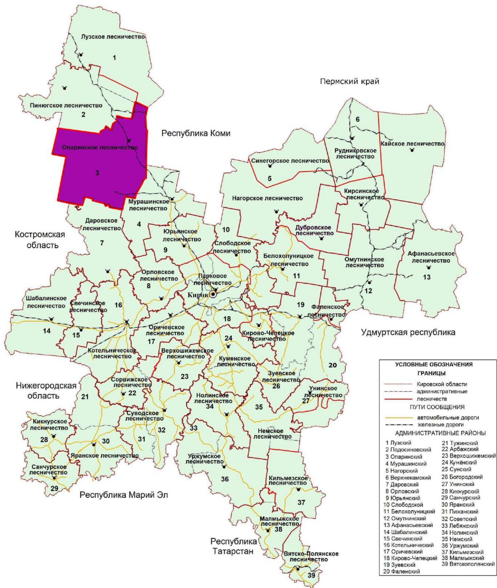
Рисунок 1. Карта-схема Кировской области с выделением территории Опаринского лесничества

территориального расположения Опаринского лесничества