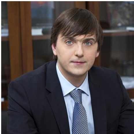
С. С. КРАВЦОВ

Министр просвещения Российской Федерации