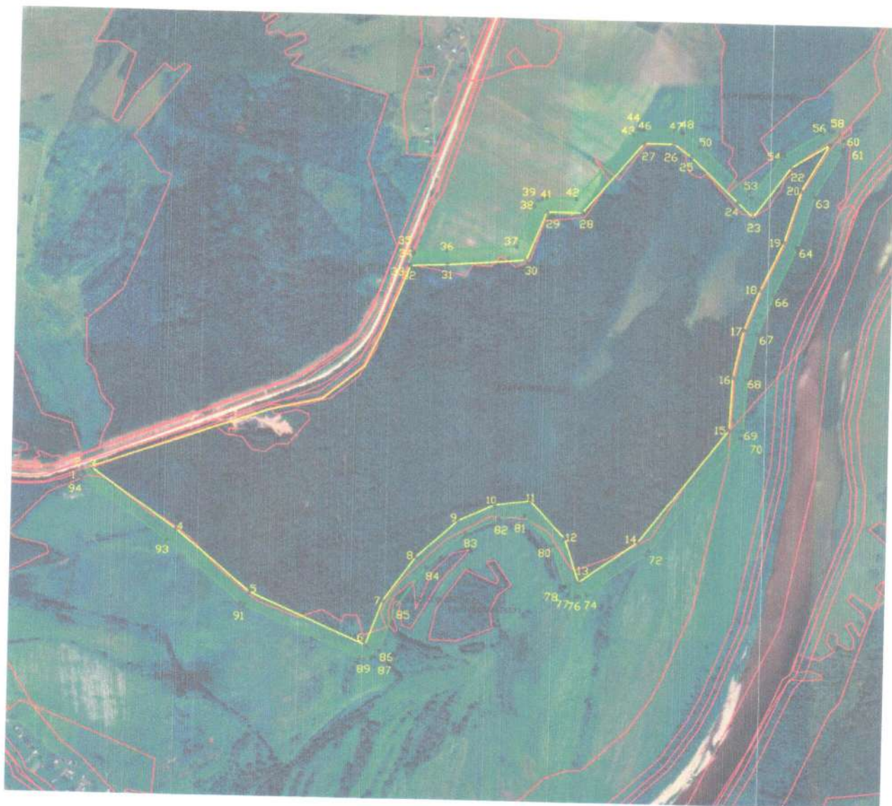
СХЕМА границ охранной зоны памятника природы регионального значения «Хомяковский бор»

к границам охранной зоны памятника природы регионального значения «Хомяковский бор»