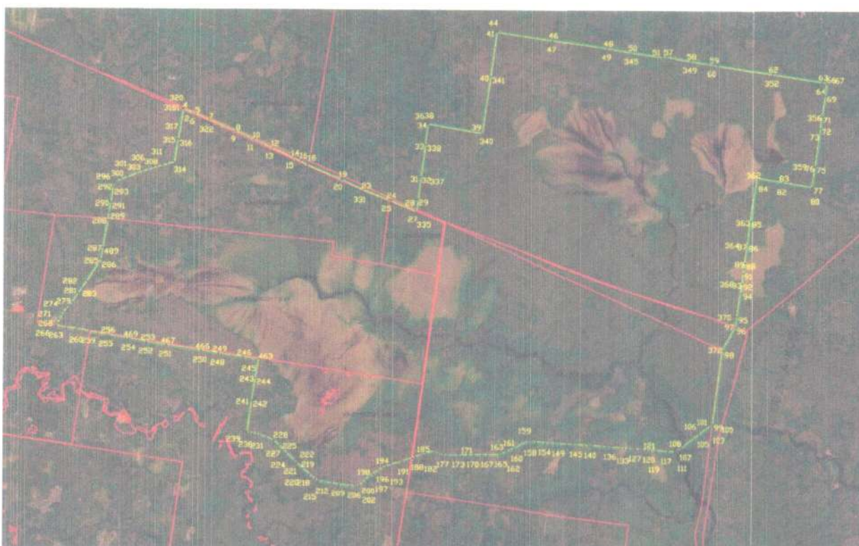
СХЕМА границ охранной зоны памятника природы регионального значения «Ульское болото»

к границам охранной зоны памятника природы регионального значения «Ульское болото»