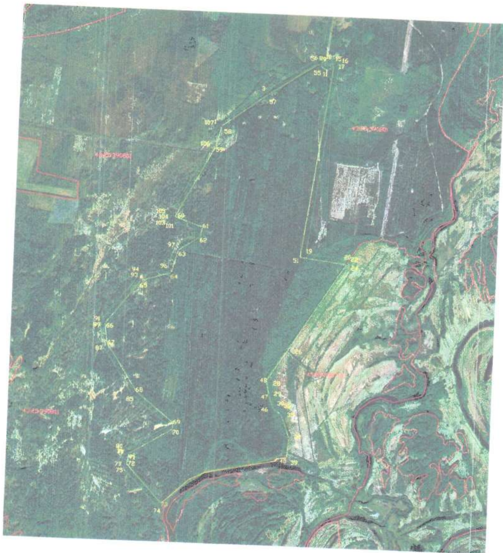
СХЕМА границ охранной зоны памятника природы регионального значения «Халтуринский лиственник»

к границам охранной зоны памятника природы регионального значения «Халтуринский лиственник»